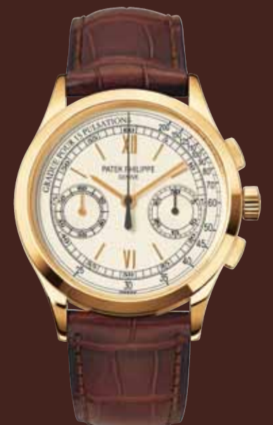
Chronographe - Or jaune (Réf. 5170J-001)