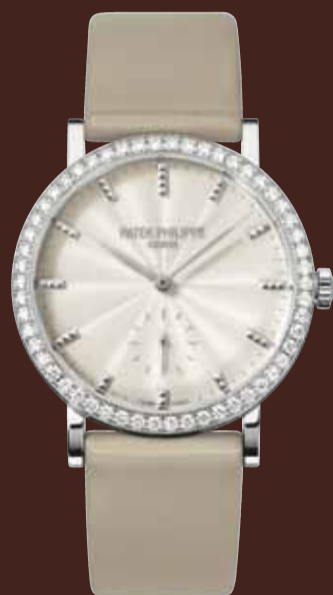
Calatrava Dame - Or gris (Réf. 7120G-001)