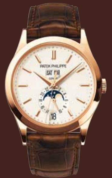
Quantième Annuel - Or rose (Réf. 5396R-011)