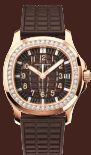
Aquanaut Luce - Or rose (Réf. 5068R-001)