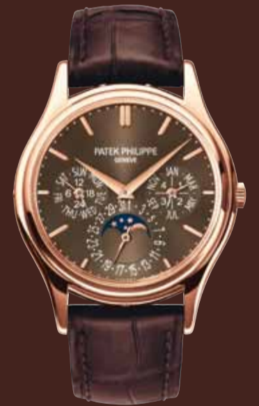
Quantième perpétuel - Or rose (Réf. 5140R-001)

Grâce à l'embrayage à disques n'entraînant quasiment aucune usure, la grande trotteuse de chronographe peut également être utilisée comme aiguille des secondes permanentes. Un fond transparent en verre saphir permet d'admirer le mouvement avec ses finitions manuelles raffinées et son rotor en or 21 carats.