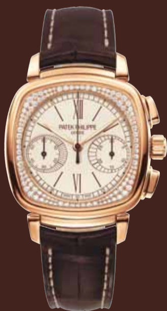
Chronographe Dame - Or rose (Réf. 7071R-001)